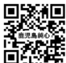
純心ホームページ